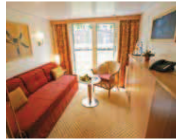
2-Bett Kabine Oberdeck (franz. Balkon)