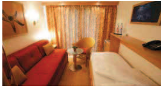
2-Bett Kabine Mitteldeck (franz. Balkon)