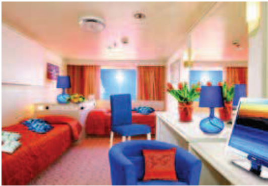
2-Bett-Kabine außen Jadedeck